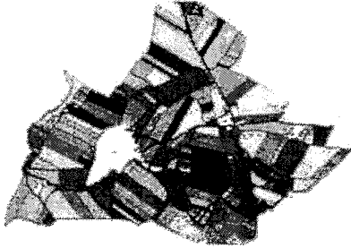
Mapa uspořádání pozemků po pozemkových úpravách

Informaci, že byla zahájena obnova katastrálního operátu novým mapováním nebo přepracováním, má povinnost zveřejnit jak katastrální úřad, tak obec, kde obnova katastrálního operátu probíhá. V případě obnovy operátu na základě výsledků pozemkových úprav je zdrojem informace zejména úvodní jednání, na které jsou zváni všichni účastníci řízení.