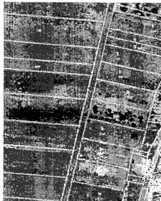
Ortofoto s obrazem katastrální mapy po obnově katastrálního operátu

O případných změnách ve výměrách parcel evidovaných v katastru, popř. o odstranění zjednodušené evidence, se tak vlastník dozví z operátu vyloženého k veřejnému nahlédnutí. Pokud této možnosti nevyužije, může se s výsledkem obnovy operátu seznámit ve webové aplikaci Nahlížení do katastru nemovitostí ( http://nahlizeni.dokn.cuzk.cz/ ), a to po vyhlášení platnosti. Pořídít si může i výpis z katastru nemovitostí, a to prostřednictvím kontaktního místa Czech POINT nebo přímo na kterémkoliv katastrálním pracovišti.